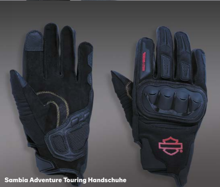
Sambia Adventure Touring Handschuhe