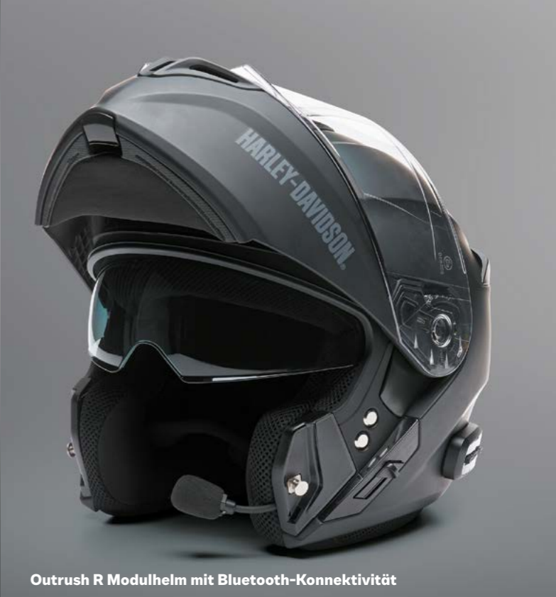
Outrush R Modulhelm mit Bluetooth-Konnektivität