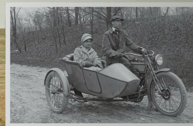
Touring im frühen 20. Jahrhundert. Das Motorrad ist ein Modell 11F aus dem Jahr 1915, ausgestattet mit elektrischem Licht und dem rechtsseitigen Beiwagen Modell 11-L.