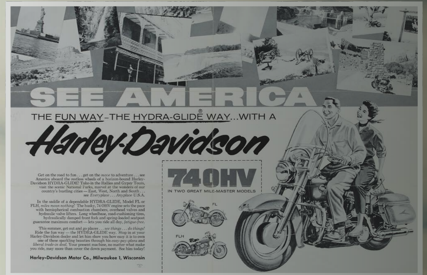
Werbeposter aus den 1950er-Jahren für Touring mit einer Harley-Davidson® Hydra-Glide®

Seit dieser Zeit hat Harley-Davidson® Touring Modelle für alle Fahrer und für jeden Anspruch hergestellt - von minimalistischen Baggern bis hin zu voll ausgestatteten Tourern. Die Produktpalette wurde 2021 weiter ausgebaut, als die Pan America™ 1250 auf den Markt kam. Ein Adventure Touring Bike, das nicht nur auf den Highways dieser Welt, sondern auch jenseits des Asphalts daheim ist.