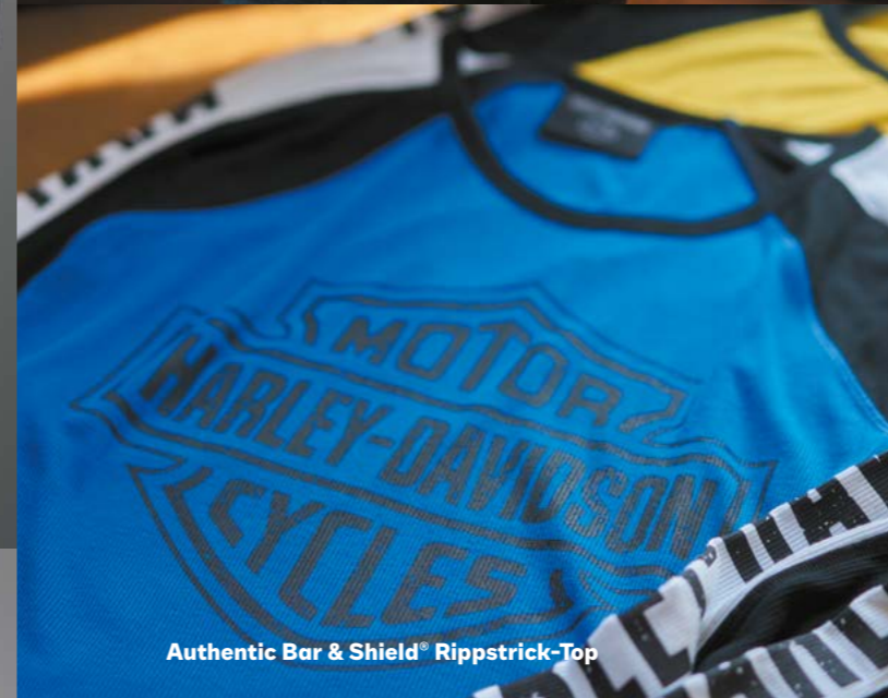
Authentic Bar & Shield® Rippstrick-Top