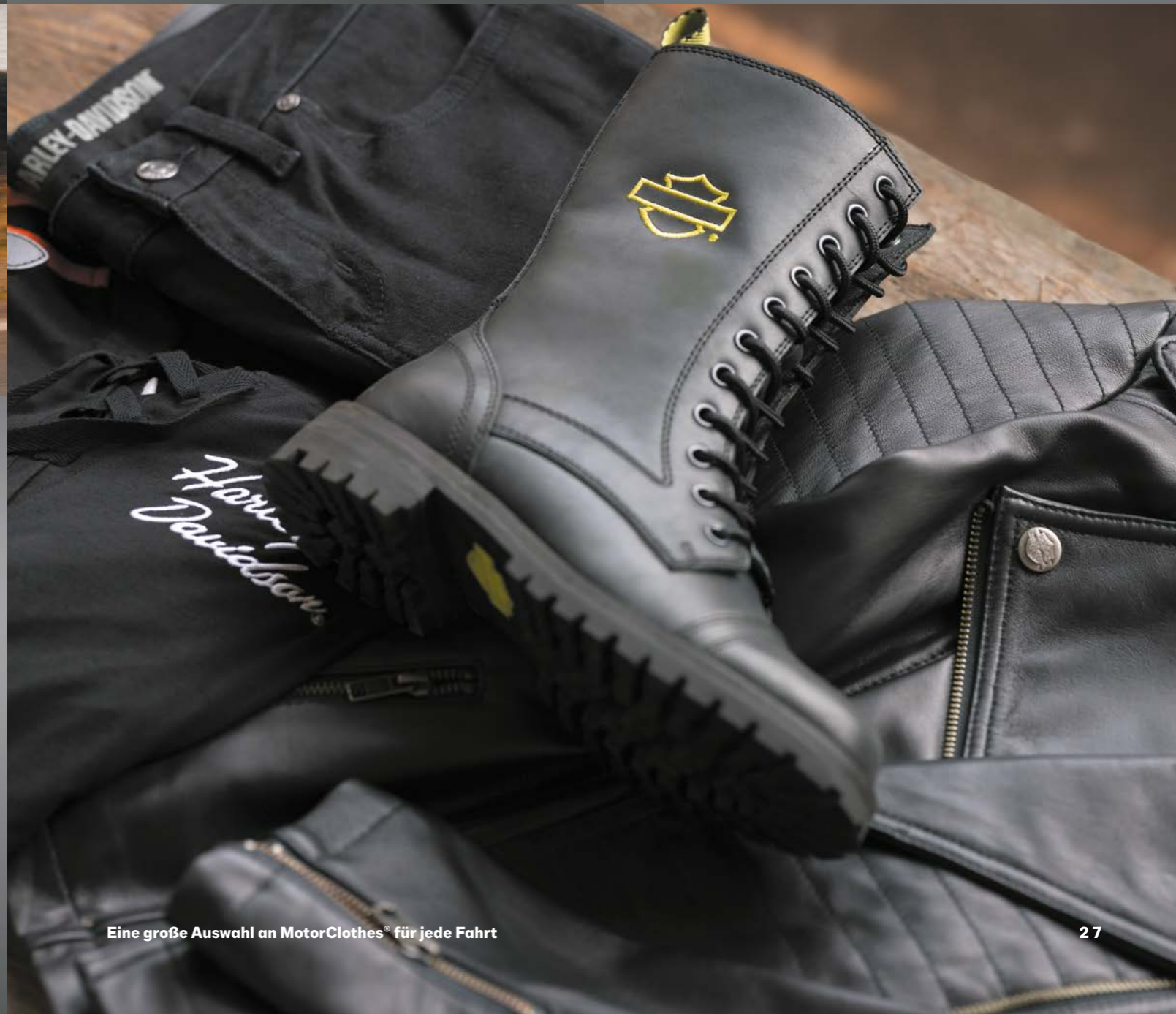
Eine große Auswahl an MotorClothes® für jede Fahrt