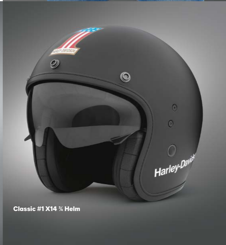
Classic #1 X14 ¾ Helm