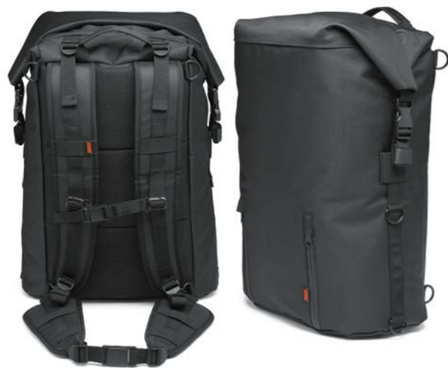
Overwatch Dry Pack