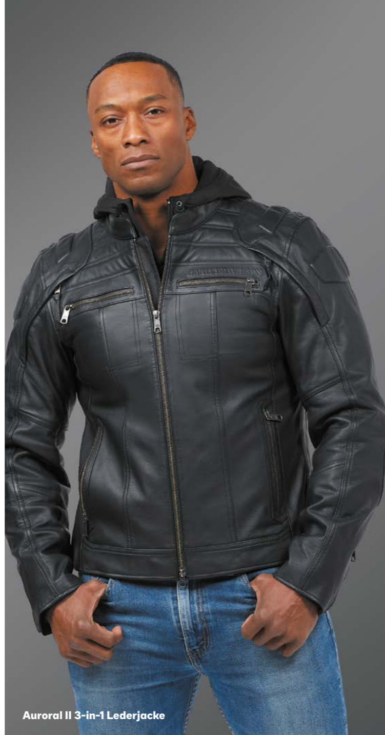
Auroral II 3-in-1 Lederjacke

Unser Anspruch an herausragendes Design findet sich auch in unserer H-D® Bekleidung und Ausrüstung wieder. Jedes Teil unserer Kollektionen ist würdig, das Bar and Shield zu tragen. Ob Jacke, Hose, Handschuhe, T-Shirt, Hemd oder Helm - spüre ab der ersten Berührung die pure und einzigartige Harley® DNA der Motor Company.