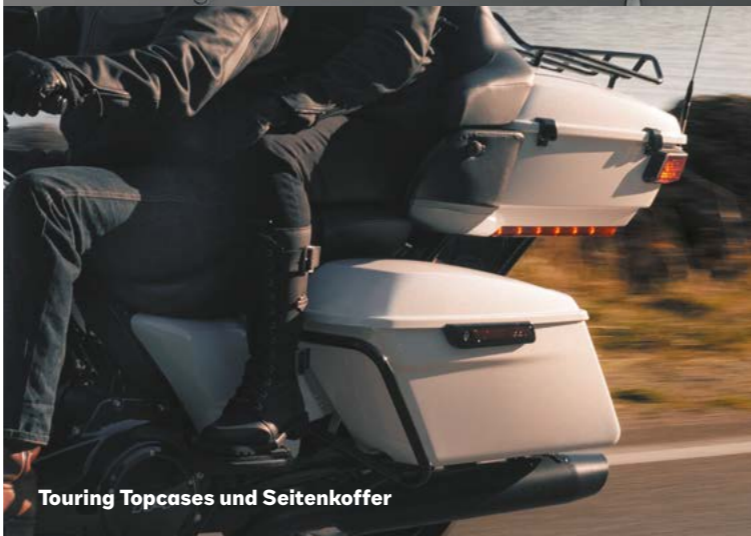
Touring Topcases und Seitenkoffer