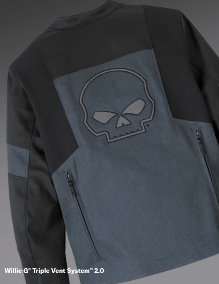
Willie G® Triple Vent System™ 2.0