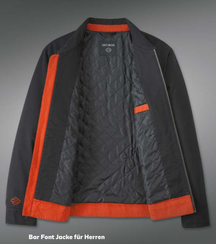
Bar Font Jacke für Herren