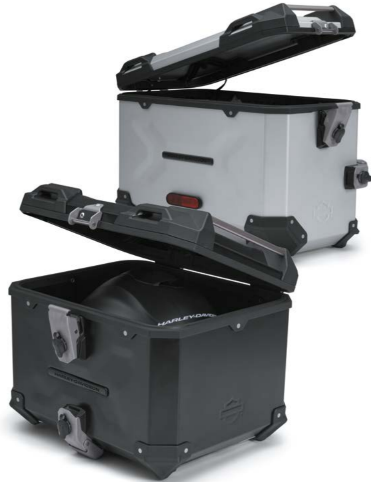
Abschließbares Top Case

Die ultimative Ausrüstung für Abenteuer gibt's in Aluminium. Das in Zusammenarbeit mit SW-MOTECH® entwickelte, abschließbare Top Case und die passenden Seitenkoffer sind in Schwarz oder Silber erhältlich und finden sicheren Halt am Kofferträger. Darüber hinaus gibt es Sport und Soft Luggage Versionen, einen Overwatch Dry Backpack, einen Pan America™ spezifischen Tankrucksack und mehr. Schau Dir alles bei Deinem Harley-Davidson® Händler vor Ort an.