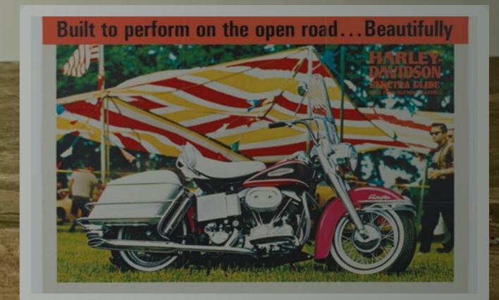
Werbeposter für die Electra Glide® aus dem Jahr 1968