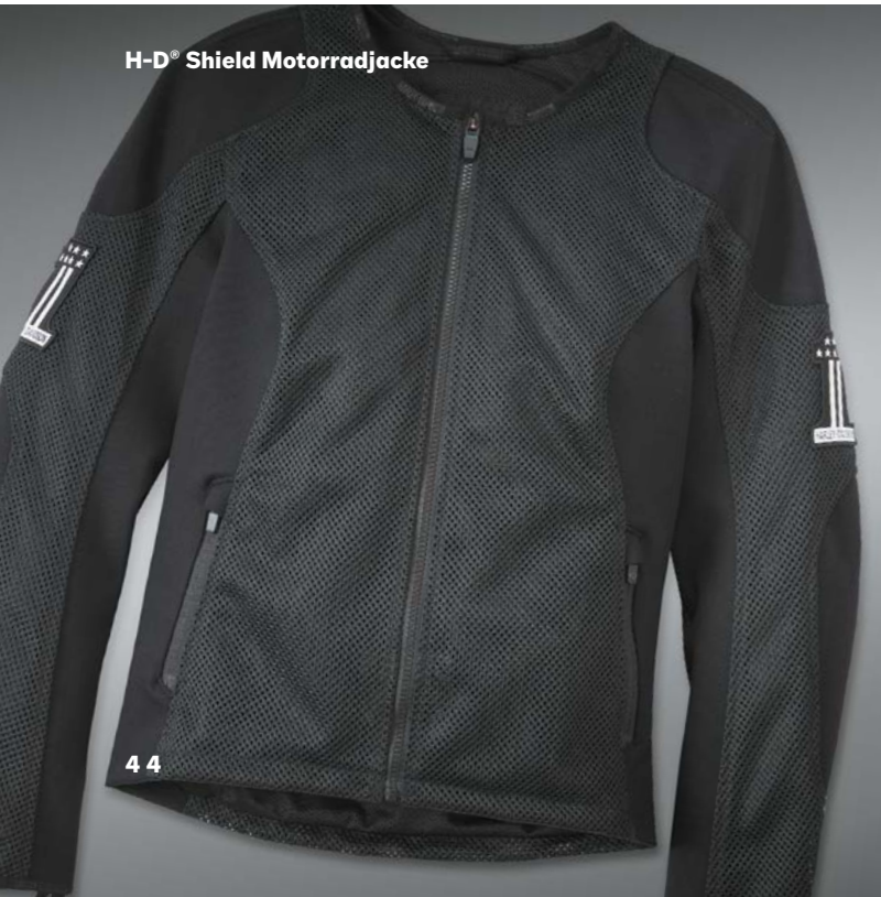
H-D® Shield Motorradjacke