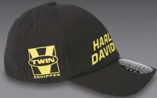
Willie G® Skull Viper Waxed Style Cap