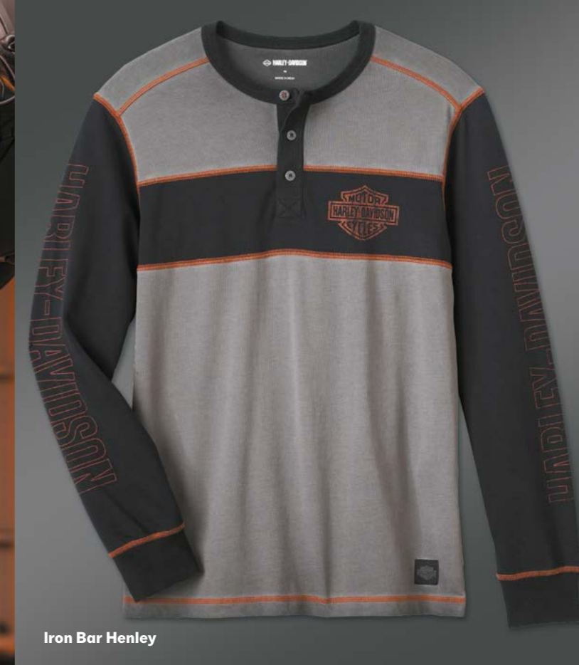
Iron Bar Henley