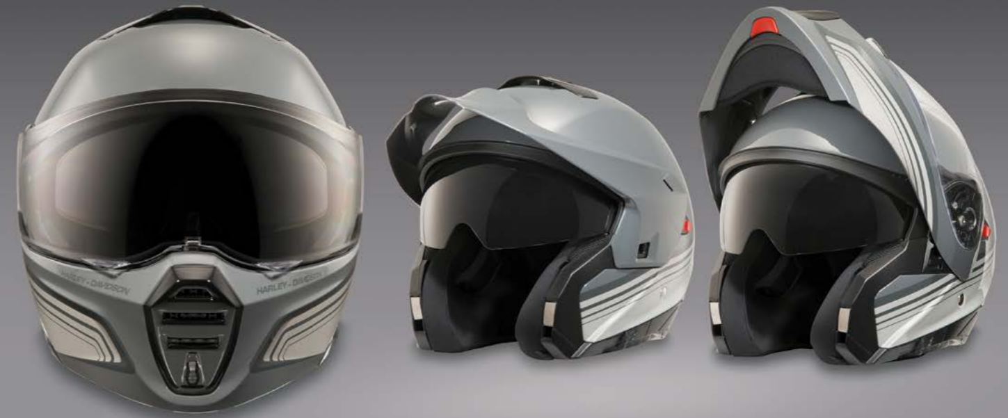
H-D® Evo X17 Sunshield Modular Helm