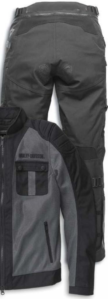
Passage Adventure Jacke