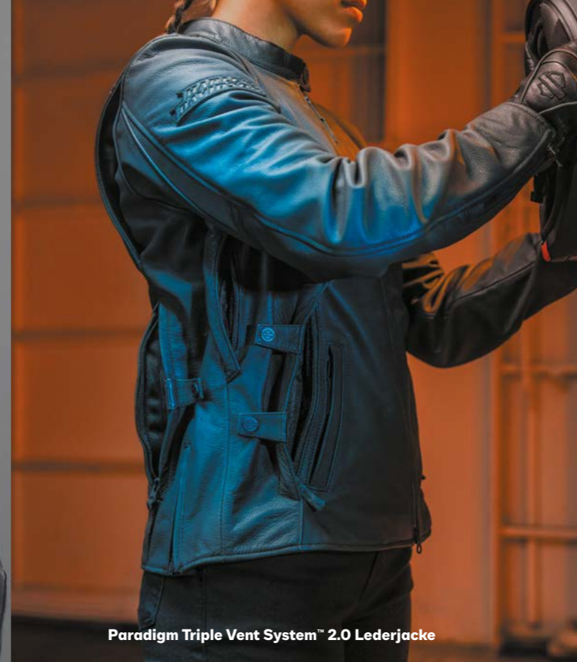
Paradigm Triple Vent System™ 2.0 Lederjacke