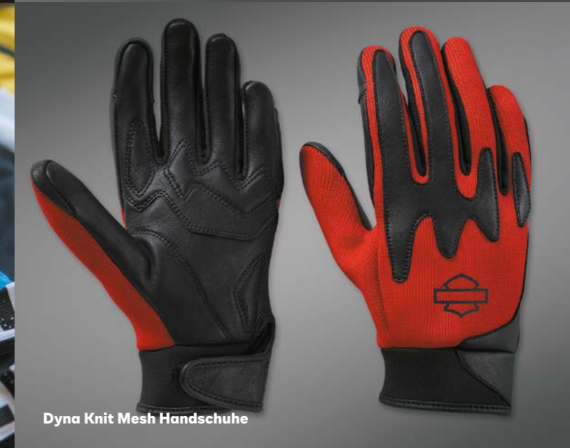
Dyna Knit Mesh Handschuhe