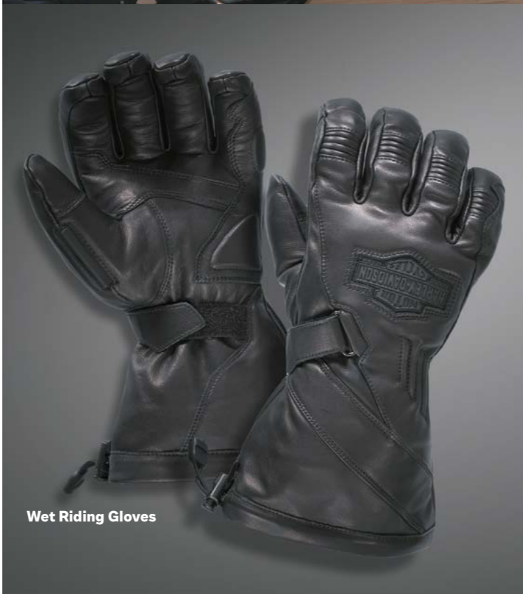
Wet Riding Gloves