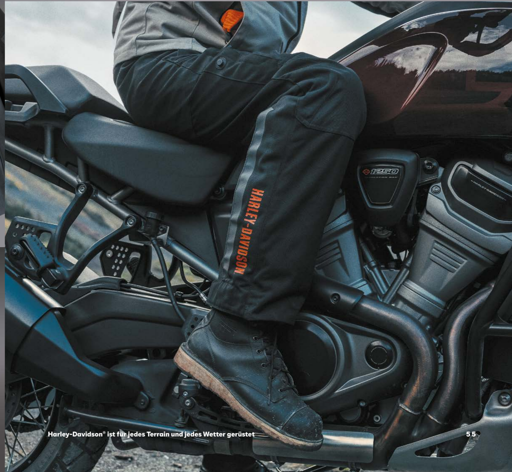
Harley-Davidson® ist für jedes Terrain und jedes Wetter gerüstet