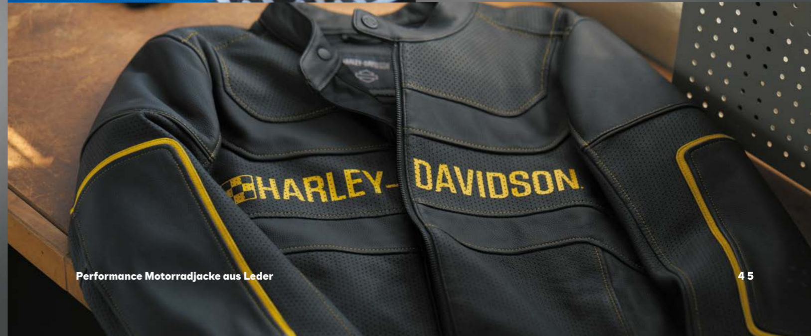
Performance Motorradjacke aus Leder